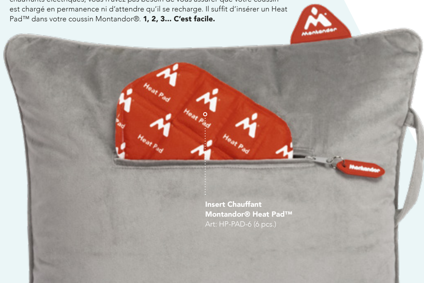
Insert Chauffant Montador® Heat Pad™ Art: HP-PAD-6 (6 pcs.)

Vous avez un peu froid ? Ne vous inquiétez pas ! Contrairement aux coussins chauffants électriques, vous n'avez pas besoin de vous assurer que votre coussin est chargé en permanence ni d'attendre qu'il se recharge. Il suffit d'insérer un Heat Pad™ dans votre coussin Montador®. 1, 2, 3... C'est facile.