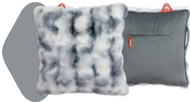
Coussin non-électrique Montador® Heat Pad™ en fourrure grise Art: HP-FF-GR