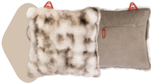
Coussin non-électrique Montador® Heat Pad™ en fourrure taupe Art: HP-FF-TP

Nous comprenons votre besoin de rester à la pointe des tendances. Nous travaillerons en collaboration avec les influenceurs et nous nous efforcerons de proposer régulièrement de nouveaux imprimés, couleurs, collaborations et matériaux pour nos coussins Heat Pad™.