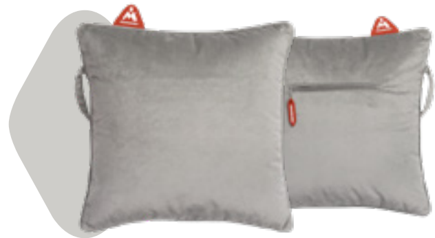
Coussin non-électrique Montador® Heat Pad™ en velours gris Art: HP-VE-CH