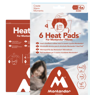
Montador® Heat Pads™ 6 pcs par boîte Art: HP-PAD-6

Conçu pour un usage unique. À partir d'ingrédients purs et non toxiques.