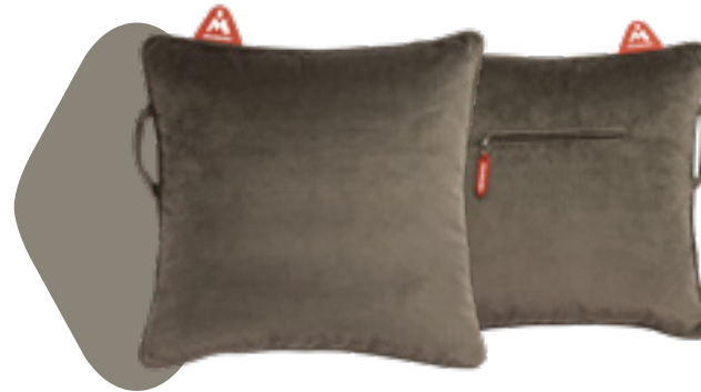
Coussin non-électrique Montador® Heat Pad™ en velours brun Art: HP-VE-BR